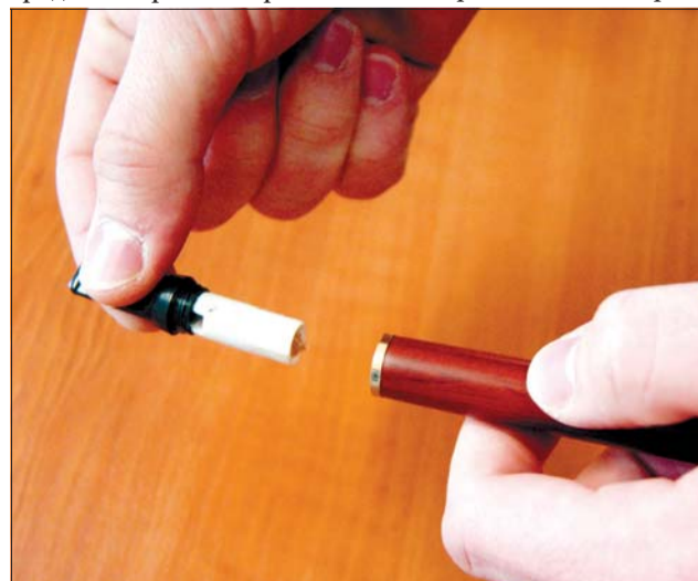
След като се изхаби, се заменя с нов.