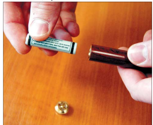
Устройството работи с батерия.