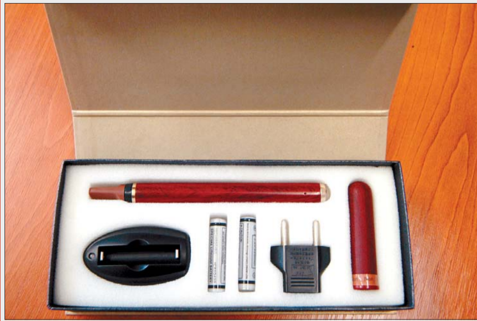
Пълният комплект се съхранява в специална кутия.