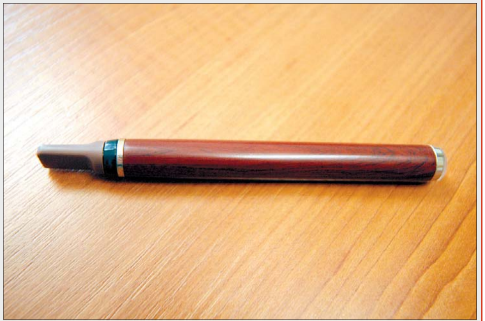
Цигарата прилича на пурета и при пушене леко се загрева в средата.