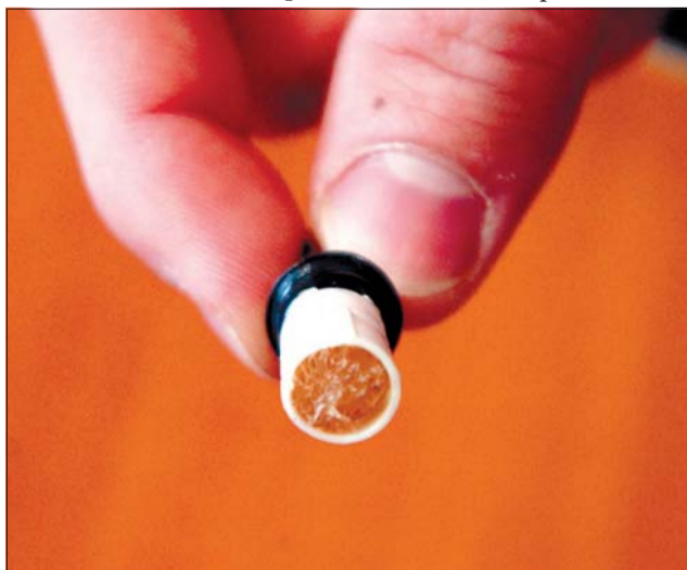
Това е пълнителят с никотинов разтвор.

съдържанието на никотин е по-малко, отколкото в една кутия. За изпушването на една обикновена цигара са нужни 14-16 дръпвания. От електронната можете да вдихате и само 2-3 пъти, колкото да си вземете малка никотинова доза, което пак ще бъде много по-безвредно. Цигарата задоволява не само никотиновия глад, но и навика да я държите в ръцете и устата си. (24 часа)