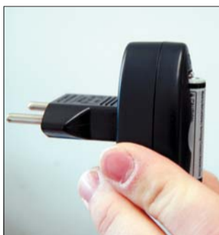
Два часа са нужни да презаредите батерията.

или поне да намалят цигарите. Новото електронно чудо предизвиква истинско изумление у околните и може би поради тази причина е особено любимо на богатите жени, свикнали да са център на внимание. Най-ценното обаче е, че не съдържа